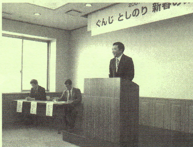
挨拶するぐんじ県議

ぐんじ 県議も、そのお言葉を引きつぎ、千葉県議会議員選挙もあと2ヶ月余りに迫って来ておりますので、現職議員としての活動報告とともに、「本選」に臨む力強い決意のほどを表明いたしました。